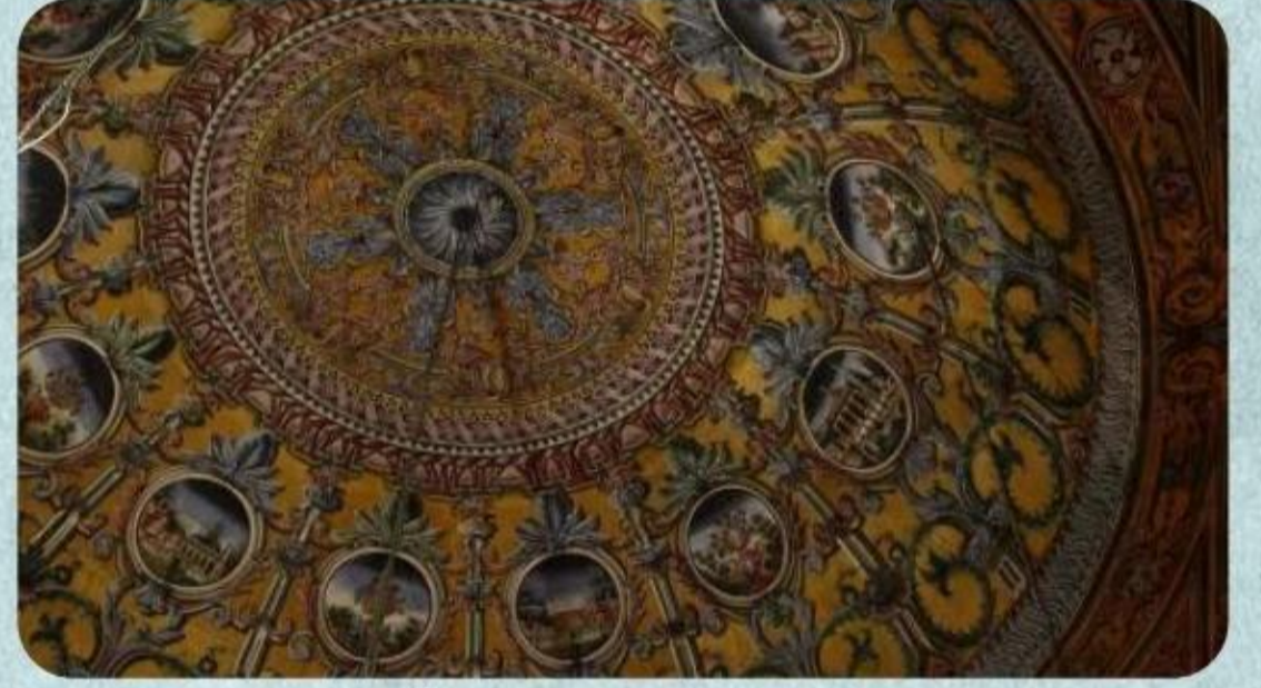
Alaca Camii, Tetova