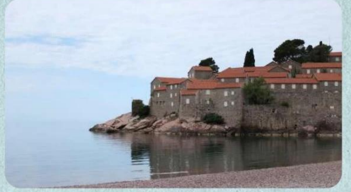
Sveti Stefan Adası, Karadağ

Gitmenizi gerçekten çok isteyeceğim yerlerden ilki Karadağ. Kotor, Budva, Perast hepsi birbirinden güzel doğal güzelliklere sahip, siyah ulu dağları, berrak mavi denizleri, tarih kokan eski yerleşim yerleri ile bu üç lokasyon aklınızı başından alacaktır. Sveti Stefan uğranılması gereken bir yer, Budva'ya 15 dakikalık bir mesafede. Perast'a gittiğinizde de Kayaların Leydisi'ne tekne ile geçmenizi öneririm. Makedonya'da Ohrid Gölü kenarındaki Saint Naum Manastırı'na tekne ile gitmenizi öneririm. Giderken de dönerken de çok güzel manzaralara şahit oluyorsunuz. Üsküp taraflarına yakınsanız Matka Kanyon'u uğramaya değer bir doğal güzellik. Tekne kullanarak Avrupa'nın en derin su altı mağrası olan Vrelo Mağarasına da gidebilirsiniz. Mağaraya giderken Matka Kanyonu'nu bir güzel gezmiş oluyorsunuz. Yine Üsküp'e yakın sayılabilecek bir şehir olan Tetova'da Alaca Camii'ne hayran kaldım, yolunuz düşerse size de gitmenizi öneririm. Arnavutluk'ta da Berat'ı katmadan planınızı yapmayınız derim. Safranbolu'yu andıran beyaz evleri ve taş sokakları gerçekten de görülmeye değer, huzur dolu bir mekan. Bosna'da herkes nereyi önereceğimi tahmin ediyordur diye düşünüyorum ama yine de söylemek isterim. Mostar. Ruhu ile, doğası ile, camileri ve Mostar Köprüsü ile gidip görülecekler listenizin üst satırlarına yazabilirsiniz.