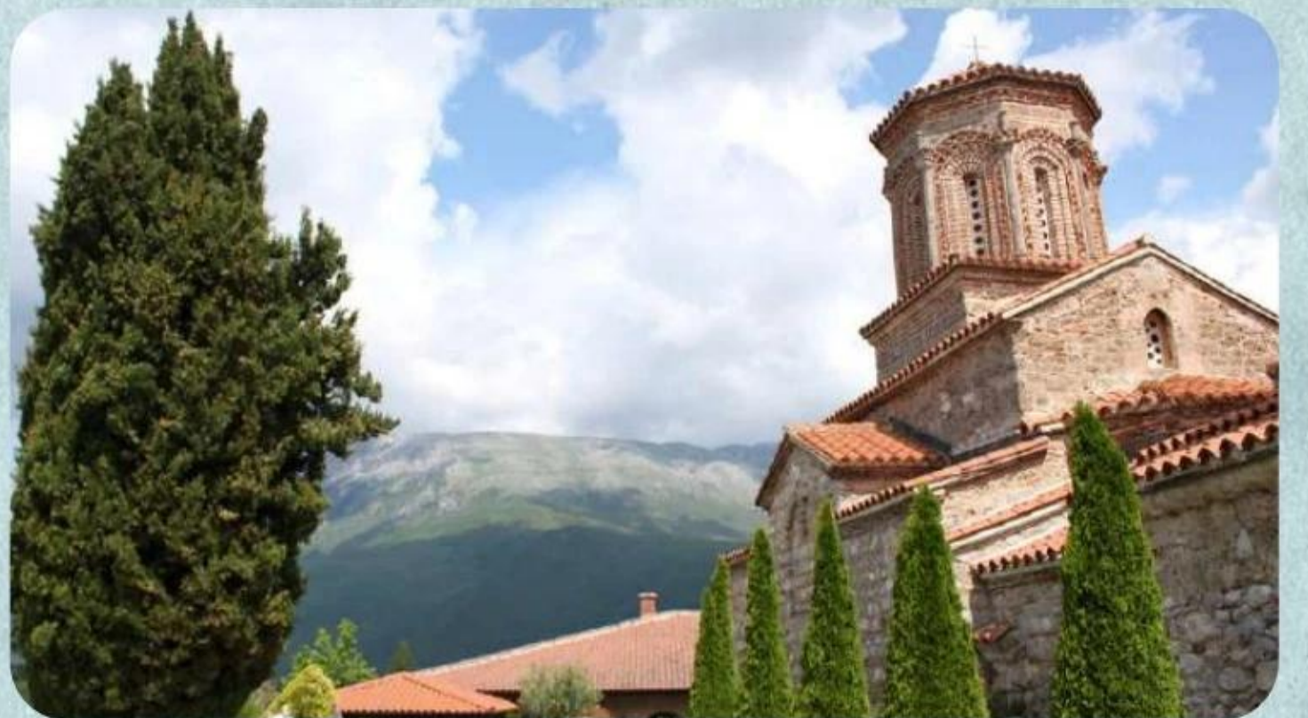
Saint Naum Manastırı