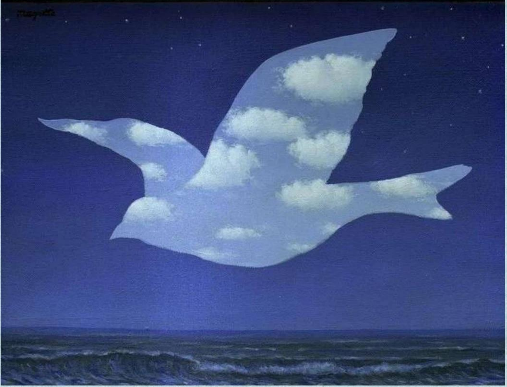
Rene Magritte, 1950